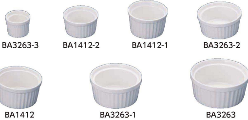
BA3263-3 BA1412-2 BA1412-1 BA3263-2 BA1412 BA3263-1 BA3263