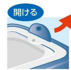
レンジ調理に最適!