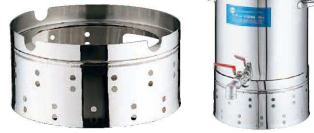
② 18-8 蛇口付寸胴専用受け台 (AUK-01)