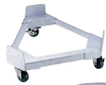
⑧ 18-8 寸胴鍋 運搬用 トライアングルキャリア(ゴム車) (AZV-68) 目

キャスター：ナイロンφ100×4 (2輪ストッパー付) ●大型寸胴鍋の使用時の重さに耐えられる高強度設計。