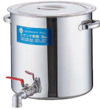
① 18-8 蛇口付 寸胴 (目盛付) (EZV-03)