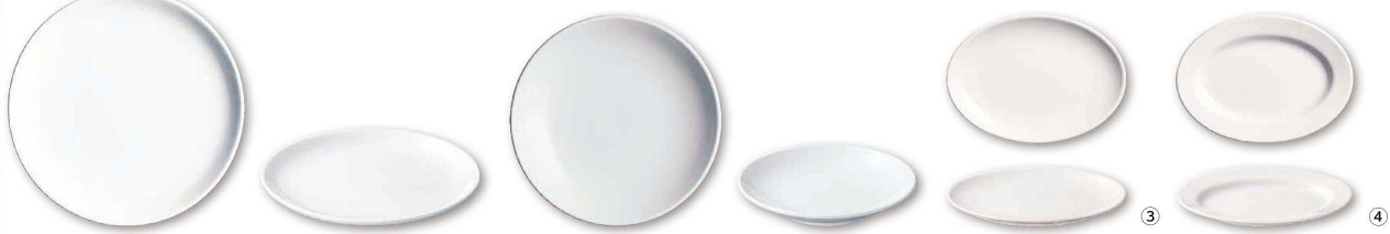
① 丸皿 (RML-M9)

陶器 町中華シリーズ シンプルで美しい形を目指した基本の中華シリーズです。業務用でも家庭でも使いやすいラインナップです。