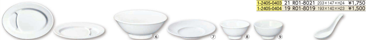
⑤ 餃子皿 (仕切付)