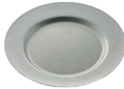
① ヴィンテージ ラウンドプレート (NUT-01) 目