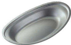
⑥ ヴィンテージ カレー皿 (NUT-04) 目