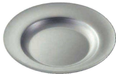
⑧ ヴィンテージ スープ皿 230 (NUT-06) 目