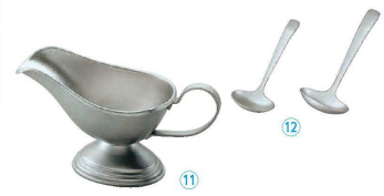
⑪ ヴィンテージ ソースポット (NUT-11) 目