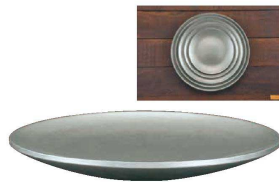
⑨ ヴィンテージ パール二重プレート (NUT-14) 目