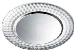
⑬ UK ステンレス ツチ目サービストレイ (NSC-57)