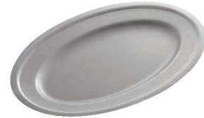
② ヴィンテージ オーバルプレート (NUT-02) 目