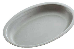
③ ヴィンテージ オーバルボウル (NUT-03) 目