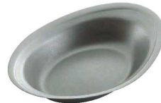
⑦ ベーカープレート (NUT-05) 目