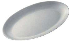
④ ヴィンテージ カフェプレート M (NUT-13) 目