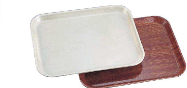
11 TKG 軽量タイプ カムトレイ (キャンブロ) 洗 (EKM-47)