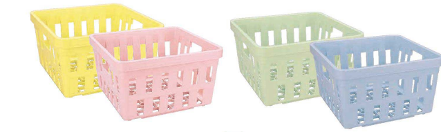
16 PP樹脂ラック (RRC-04) ¥9,240 洗 1-2465-1601 PP90-01 イエロー 1-2465-1603 PP90-03 グリーン 1-2465-1602 PP90-02 ピンク 1-2465-1604 PP90-04 ブルー 外寸:387×369×H224 内寸:365×345×H212 耐熱:120℃ (熱風消毒保管機対応) 質量:1,100g ●耐衝撃性能に優れ、割れにくい設計です。