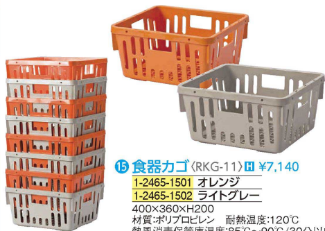
15 食器カゴ (RK-11) ¥7,140 1-2465-1501 オレンジ 1-2465-1502 ライトグレー 400×360×H200 材質:ポリプロピレン 耐熱温度:120℃ 熱風消毒保管庫温度:85℃~90℃/30分以内 ●本体と一体型の持ち手で、スタッキング可能です。