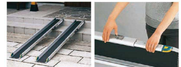
■スロープの長さや適応する段差の高さの目安

6 ワンタッチスロープ (ZSL-06) 目録 1-2500-0601 ¥78,000 1,290(最大2,090)×275×H70 質量: 15kg (1セット) 材質: アルミ合金 耐荷重: 300kg (1セットあたり) ●簡単5段階伸縮、レバー操作で1,290~2,090mmまで5段階の長さ調節できます。 ●持ち運びに便利な持ち手付。 ●下方接地面はスレ防止ゴム付。 ●走行面は車椅子の車輪が滑りにくい表面加工がしてあります。 ※電動三輪車、車軸及び電動ユニットの最低地上高が8cm以下の車椅子、タイヤ幅が13cm以上の車椅子にはご使用になれません。