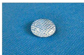
強撥水効果で拭き取り簡単。