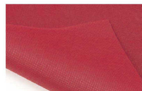
両面使えて経済的。