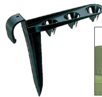
ヒモストッパー付き