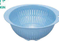
⑫ トンボ アシストざる ブルー (AZL-94) 洗(抗菌)