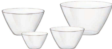
④ ベーシック サラダボール(ABC-F5)