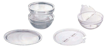
⑥ ポリカーボネイト サラダボール用スタッキングカバー(NSL-B9)