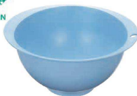
⑪ トンボ アシストボール ブルー (ABC-F3) 洗(抗菌)