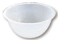
⑧ マトファ PPミキシングボール(ABC-99)