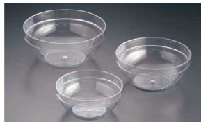
⑤ ポリカーボネイト サラダボール(NSL-73)