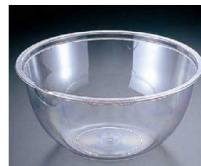
⑨ ポリカーボネイト クックボール 洗(ABC-83)