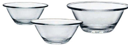
② ミスターシェフ サラダボール(RBR-40)