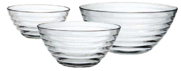
③ ビバ ボール(RBB-05)

●ショックに強い全面強化ガラス製。 ●食器に近い繊細なシェイプは、テーブル用にもキッチン用にも大活躍。 ●大きいサイズはバイキングにもピッタリです。