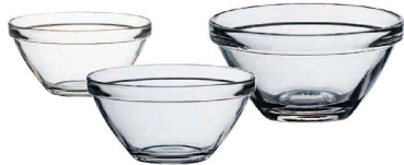
① ポンペイ ボール(ABC-91)