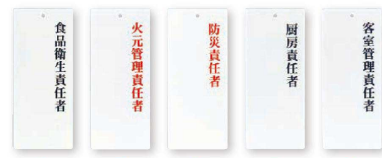
⑫ ⑬ ⑭ ⑮ ⑯