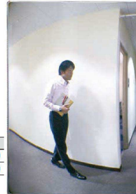
※写真はミラーに映った状況を表しています。

材質:ミラー/特殊プラスチック ベース/アルミニウム 厚さ:3.9mm ●T字路が多い病院・学校・工場などの人が行き交う場所に役立ちます。 ●ミラーに映る大きさは、大は小の約2倍です。 ※室内専用ですが、日光が当たる場所や高温・多湿の場所は設置できません。