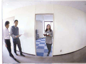
※写真はミラーに映った状況を表しています。