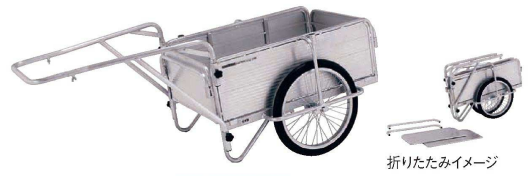
折りたたみイメージ

530×2,060×30 質量:1,100g 材質:本体/アルミ グリップ/ゴム ●サスマタは古来からの防犯用具で、最低限の力で抑え込め事ができます。