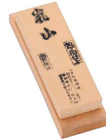
④ 天然砥石 人造嵐山砥石仕上(台付) (#6000) 〈ATI-41〉 1-0348-0401 ¥7,600 仕上:213×74×H24 (砥石のみ)