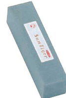
⑨ GC角朝日虎印金剛 荒砥石 2丁掛 (#240) 〈ATI-67〉 1-0348-0901 ¥5,300 205×50×H50