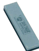
⑮ GC/C コンビ 朝日虎印 荒砥石 No.10 (#120/#250) 〈ATI-73〉 1-0348-1501 ¥2,800 205×50×H25