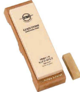
② キングゴールド 最終超仕上砥石 G-1型 (#8000) 〈ATI-69〉 1-0348-0201 ¥16,500 210×73×H22 (砥石のみ) ●面直し用名倉砥石付