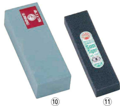
⑩ 赤エビ印 金剛砥石 (No.400) 〈ATI-09〉 1-0348-1001 ¥9,400 210×78×H52