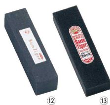
⑫ C角朝日虎印金剛 荒砥石 No.100 2丁掛 (#120) 〈ATI-71〉 1-0348-1201 ¥4,600 205×50×H50