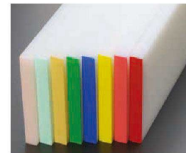
カラーバンド張り(Aタイプ) ※カラー部分張り付け接合タイプ ピンク・ブルー・ベージュ・グリーン・ 濃ブルー・イエロー・濃ピンク・赤