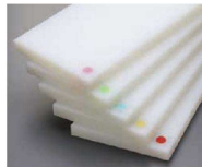
カラーうめ込み(大) φ24mmは表面のみ ピンク・グリーン・ブルー・ ベージュ・赤