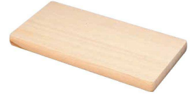
④ スプルズ まな板(合わせ板) (AMN-N7)