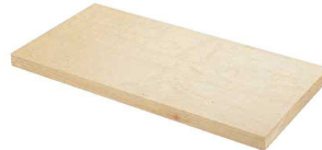
③ スプルズ まな板(カナダ産) (一枚板) (AMN-13)