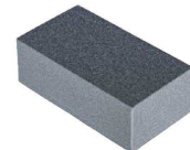
⑦ まな板削り カuttingボード シェーバー KBS-002 (AKT-H1) 1-0379-0701 ¥500

56×91×H30 材質:本体/発泡ポリエチレン ヤスリ/研磨材 ●両面に特殊研磨材を貼付。 ●プラスチック製まな板にも御使用できます。 ●独自の2ステップ削りで従来品の約2倍のスピードで削れ、仕上がりがソツソツ!