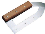
⑧ 強力ダブルエッジ スクレーパー DE-1 (ステンレス鋼) (ASK-18) 1-0379-0801 ¥8,400

50×90×H30 材質:本体/発泡ポリエチレン ヤスリ/研磨材 ●プラスチック製のまな板にもご使用できます。