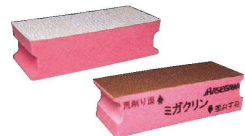
⑤ まな板削り ミガクリン MC-115P (AMN-11) 1-0379-0501 ¥1,100

115×50×H30 材質:本体/発泡ポリエチレン ヤスリ/酸化アルミニウム・ステアリン酸亜鉛 ●荒削り面・仕上げ面で素早く汚れ、黄ばみや黒ずみを落とします。 ●樹脂製・木製の調理器具にご使用できます。