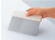
⑩ まな板用 プラ柄スクレーパー (ASK-66) 1-0379-1001 ¥1,850