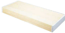
② 木曽檜 まな板(合わせ板) (AMN-12)