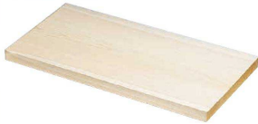
① 木曽檜 まな板(一枚板) (AMN-14)