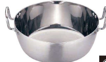
② クラッド鍋 両手雪平鍋 (AYK-69)