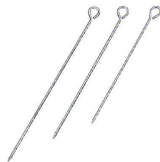
⑥ 陳枝記 18-8 チキン針 (10本入) (BTK-39)