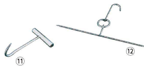
⑪ 18-0 肉フック M (BNK-25)