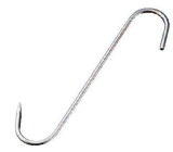
⑤ 陳枝記 ステンレス チキンハンガー RRH206 (BTK-37)