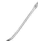
⑲ ヴォストフ ピケ針 (曲) 4382 (BDL-06)