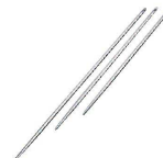
⑱ 鉄 チキン針 (BTK-05)