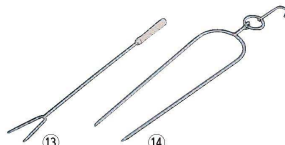
⑬ 中国製 木柄肉さし F-13 (ステンレス製) (BNK-35)