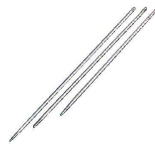
⑰ 18-8 チキン針 (BTK-26)