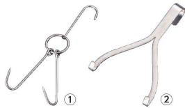
① 陳枝記 ステンレス 焼鴨フック (BTK-41)