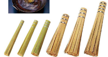
10 竹製ササラ (ASS-16)