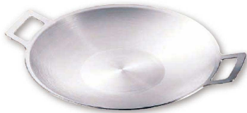
1 ドンナム 三層鋼 チゲグリルパン (AGL-B9)