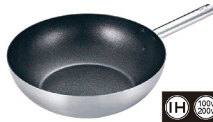
4 トリノ 中華鍋 (内面フッ素樹脂加工) (ATY-D3)