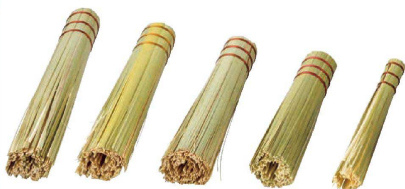
11 竹製ささら (ASS-15)

1-0427-0901 青 1-0427-0902 赤 φ43×H250 耐熱温度：120℃ ●製造工程において樹脂を接着固定し脱毛を抑え、異物混入のリスクを低減します。 ※樹脂製ブラシのため、熱いままの鍋にはご使用いただけません。