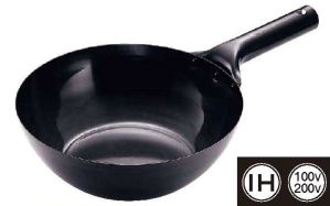
6 IH 鉄 北京鍋 (APK-25)

〈ATY-01〉 ¥30,400 1-0427-0501 内 φ310×H90 質量：1,100g 底径：145