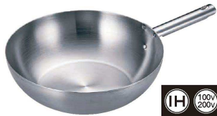
3 トリノ 中華鍋 (ATY-D2)