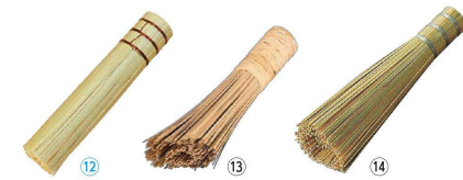
12 キッチン竹ささら 836697 (AKT-G5)