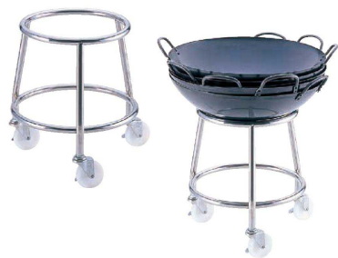
7 18-8 鍋置台

〈AOK-01〉 ¥32,000 1-0427-0701 φ370×H400 上径外寸：φ300 キャスター：φ75×3 自在(ストッパー付) 耐荷重：50kg