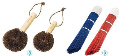
8 亀の子束子PRO 鉄器洗い (AKM-73)

〈AOK-01〉 ¥32,000 1-0427-0701 φ370×H400 上径外寸：φ300 キャスター：φ75×3 自在(ストッパー付) 耐荷重：50kg