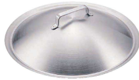
2 ドンナム チゲグリルパン 専用カバー (AGL-C0)

●三層鋼は抜群の熱効率を持ち、しかも、保温性、耐久性に優れた「ステンレス+アルミ+ステンレス」サンドイッチ構造の複合新素材です。