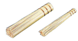
15 竹製 ささら (銅線巻) (ASS-09)

1-0427-1401 ¥870 全長：235 ●中華鍋のコゲ落とし洗浄に ●魚の腹わた取りにも使用できます。