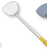
③ 18-0 中華ヘラ (ATY-13)