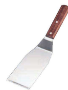
⑲ 18-0 木柄 餃子ターナー

(AGY-23) 1-0429-1801 ¥1,470 75×180×全長385