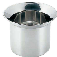
⑫ 18-8 中華カス入れ (ATY-77)

(AAB-11) 1-0429-1101 ¥15,000 φ330 (内φ278) ×H187