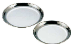
⑭ AM-3 抗菌 市場用丸皿 (BIT-07)