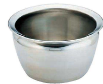
⑪ 中国製 ステンレス 油受け

(AAB-11) 1-0429-1101 ¥15,000 φ330 (内φ278) ×H187