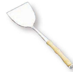
⑦ 18-8 夕華 起しヘラ (AYU-02)