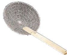
⑩ 18-8 中国製 油こし (AAB-23)

(AAB-24) 1-0429-0901 ¥900 φ155×140×全長300 材質:18-8ステンレス ●目の大きな特殊網を使用しているため、油きりが簡単にできます。