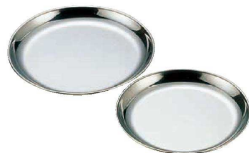
⑬ 18-0 市場用丸皿 (BML-03)