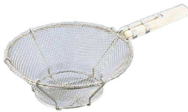
⑧ 18-8 本職用木柄 アミ式油こし (7メッシュ)

(AAB-09) 1-0429-0801 ¥9,400 φ280×460×H100