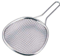
⑨ 板前さんの油きり名人 30641 (4メッシュ)

(AAB-09) 1-0429-0801 ¥9,400 φ280×460×H100