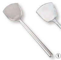
① ステンレス パイプ柄 ワンピース中華ヘラ (ATY-B8)