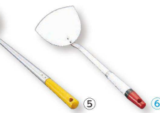
⑤ 18-0 家庭用中華ヘラ (ATY-A1) 1-0429-0501 ¥1,080