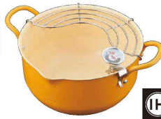
⑦ カラッフル揚げ鍋 20cm