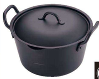
④ IH 鉄 たっぷり深型揚げ鍋 20cm(蓋付)