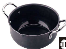
⑤ 鉄 ミニ揚げ鍋16cm