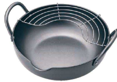
② 極天 極厚揚げ鍋 (AAG-54) 凹