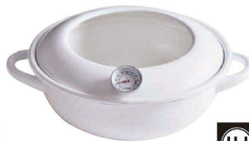
⑪ コージーック ホーロー