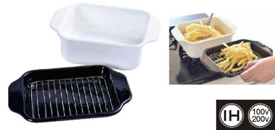
⑨ コージーック ホーロー 角型