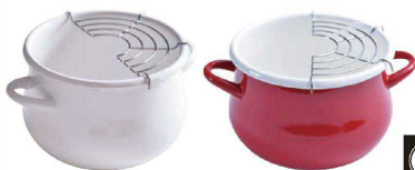
⑩ コージーック ホーロー ミニ天ぷら鍋 16cm