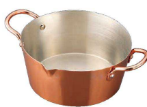
⑧ からっと銅のあげなべ