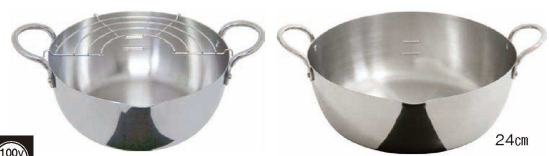
⑫ ステンレス揚げ鍋 (AAG-51) E