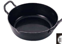
③ 鉄 本格揚げ鍋 24cm