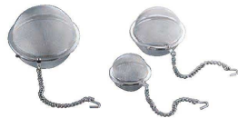
⑤ 18-8 ボール茶こし(40メッシュ) (BTY-43) B