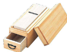
⑫ 替刃式 木製かつ箱 匠 (ツガ材) (BKT-A1) B 1-0446-1201 ¥15,000 278×115×H130 付属品: 替刃50mm幅×1枚、ネジ×1組 ●替刃は最高級鋼を使用し[完全直使]に仕込んであり、シャープな切味をお約束致します。