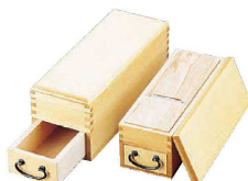
⑪ 木製 かつ箱 (スプル材) (BKT-76) 1-0446-1101 大 252×94×H100 ¥7,400 1-0446-1102 中 243×94×H100 ¥5,500 1-0446-1103 小 228×80×H 83 ¥4,600