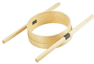
① 木製 外棒式 ダシコシ輪 (BDS-01)