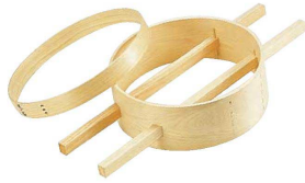
② 木製 内棒式 ダシコシ輪 (BDS-02)