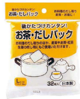
⑥ お茶・だしパック 入庫 L (32枚入) (BOT-53) 1-0446-0601 ¥260

110×110 原材料:不織布 ●お料理のだし取りのほか、麦茶やお茶、紅茶、生薬の煎じ用にもご使用いただけます。