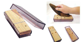
⑬ コンパクト型 鯉節削り器 鯉姫 (BKT-G6) B 1-0446-1301 ¥2,800 165×54×H50 材質:本体/木製(ホワイトオーク) 容器/AS樹脂 ●透明ケースなので削った量、削り具合が一目でわかります。