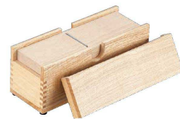
⑨ 木製 業務用かつ箱(タモ材) 小 (BKT-03) 1-0446-0901 ¥36,000 275×100×H112