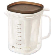
⑦ レンジで美味しいおだし洗 RE-1510 (BDS-34) 1-0446-0701 ¥2,000

110×110 原材料:不織布 ●お料理のだし取りのほか、麦茶やお茶、紅茶、生薬の煎じ用にもご使用いただけます。