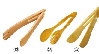
22 炭化竹 サーバートング