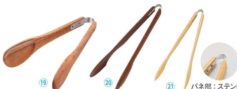
19 ケヴンハウンドスタイル トング