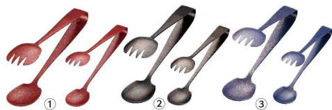
SA 18-0 和 サラダサービストング