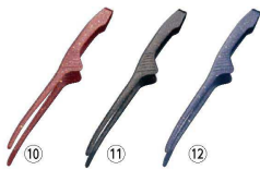
18-0 和 クレーパートング エコノミータイプ