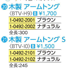
20 木製 アームトング