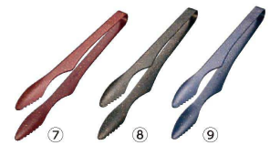
TKG 18-0 和 惣菜トング