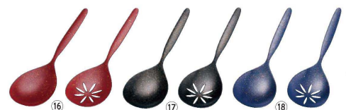
SA 18-8 和 ラージサーバースプーン