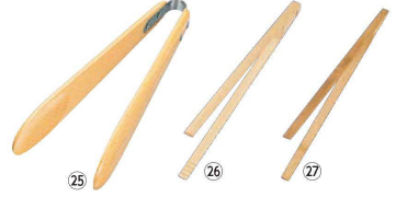
25 ブナ トング (BBN-03)