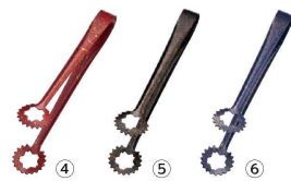
SA 18-0 和 天ぷらトング