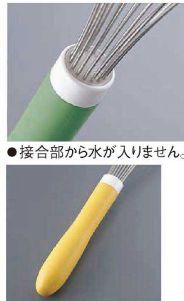
●接合部から水が入りません。