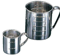
⑤ 18-8 口無し水マス (BMZ-02)

10φ φ250×H220 最小目盛:2,000c.c. ●メジャーカップにハンドルが付いている為、注ぐ時などに楽にでき大変便利です。