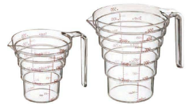
⑬ 電子レンジ対応 段々計量カップ クリア (BDV-28) 目

⑩～⑫ 材質:耐熱ガラス ●中からでも見える目盛り、液体だけではなく「さとう」「こむぎこ」の目盛り(g)がついています。 ●湯せんや電子レンジなど温めながらの調理に最適です。