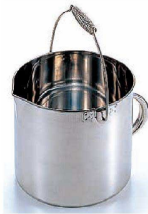
④ 18-8 ハンドル付 メジャーカップ (BMZ-18) 1-0510-0401 ¥16,000

10φ φ250×H220 最小目盛:2,000c.c. ●メジャーカップにハンドルが付いている為、注ぐ時などに楽にでき大変便利です。