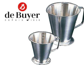
⑥ デバイヤー 18-10 水マス (BMZ-11) 目