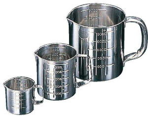
① 18-8 口付水マス (BMZ-01)