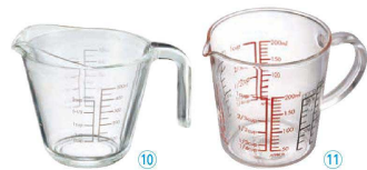
⑩ ハリオ メジャーカップ (BMZ-56) 目