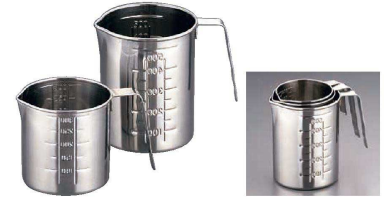
③ 18-8 ネスト メジャーカップ (BMZ-43)

(BBC-08) 1-0510-0201 ¥13,000 3.7φ 193(φ183)×H164(深さ150) 最小目盛:500c.c. ●ハンドル、注ぎ口付きなので液体を注ぎやすいです。