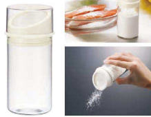
⑦ 粉ふりボトル K5041-WKF (BKN-24) 1-0524-0701 ¥1,400

●ハンドミキサーなどで調理をする時に材料が飛び散りにくく、操作しやすい縦長デザイン。用途に合わせてジャグとカップを使い分けてください。 ※ミキサーはバーミックスガストロが適しています。