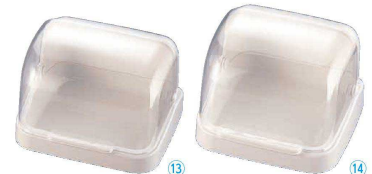
⑬ Nフォルマ フード22 ホワイト (AHC-87) 1-0524-1301 ¥2,250 228×236×H179

45×53×H31 材質：ポリプロピレン ●液だれしにくい注ぎ口 ●500ml、1Lのペットボトルしょうゆでネジキャップ直径30mmに対応 ※一部取付られないものがあります。