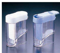
⑩ だしがげん ME-101 (BDS-08) 1-0524-1001 ホワイト ¥730 1-0524-1002 ブルー

87×40×H100 105c.c. 材質：本体/AS樹脂(耐熱70°C) フタ/ポリプロピレン ●一振りして約4gの分量が出せます。