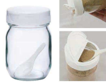
⑧ 2wayボトル 320 (BBT-A5) 1-0524-0801 ¥600

φ61×H123 容量：140ml 材質：本体/耐熱ガラス フタ/AS樹脂(耐熱90°C) メッシュ/ポリプロピレン、 ポリエステル(耐熱70°C) パッキン/シリコンゴム(耐熱200°C) ●メッシュタイプの振り口は小麦粉や片栗粉、ココアなどの粉振りにピッタリです。 ●本体は耐熱ガラス製で汚れもカンタンに落ち、におい移りもありません。