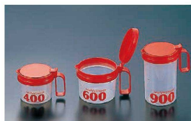
⑪ ツイストパック 2 ハンディ (ATY-64) 1-0524-1101 TX-12H φ106×143×H 93 470c.c. ¥550 1-0524-1102 TX-11H φ123×165×H104 725c.c. ¥650 1-0524-1103 TX-16H φ106×143×H170 960c.c. ¥650 1-0524-1104 TX-15H φ123×165×H187 1,500c.c. ¥750

87×40×H100 105c.c. 材質：本体/AS樹脂(耐熱70°C) フタ/ポリプロピレン ●一振りして約4gの分量が出せます。