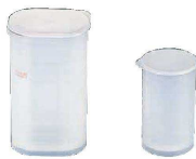
⑥ PPクッキングジャグ&カップセット (BKT-A3) 1-0524-0601 ¥2,500

ジャグ 110×90×H187 滴水1200c.c. カップ φ80×H131 滴水460c.c. 材質：本体 ポリプロピレン 蓋 ポリエチレン