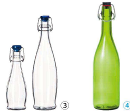
③ リビー ウォーターボトル (RLB-JG)

●オリーブオイルにハーブを入れて風味をつけるために使用したり、アルコールにフルーツを入れて、フルーツ酒作りに。醤油に様々なものを入れてたりして、和食の隠し味等に使用する調味料用としてもご使用できます。