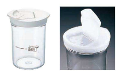
⑨ プルー ソルト&ペッパーポット (BSL-26) 1-0524-0901 L 250c.c. φ72×H100 ¥600 1-0524-0902 S 125c.c. φ60×H 80 ¥500

φ78×H117 容量：320ml 材質：本体/ソーダガラス フタ/ポリプロピレン パッキン/シリコンゴム ●スプーン付