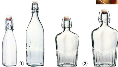
① スイング ボトル (RBR-51)