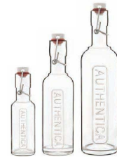
⑤ ボルミオリルイジ オーセンティカ スイングボトル (RBR-D5)