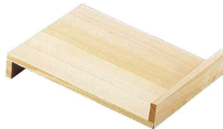
③ 木製 関西型作り板

1-0536-0201 大 390×320×H70 ¥8,400 1-0536-0202 小 360×300×H60 ¥8,000