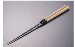
⑩ 極上白木柄 盛箸 (積層強化木柄付) (BML-24)

cm ¥ 1-0536-0801 27 ¥680 1-0536-0802 30 ¥700 1-0536-0803 33 ¥740 材質：天然竹