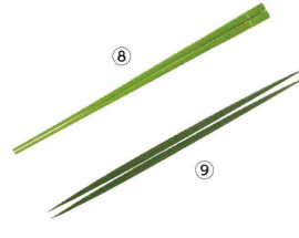
⑧ 青塗菜箸 (ASI-A4)

cm ¥ 1-0536-0701 15 ¥11,200 1-0536-0702 18 ¥16,500 1-0536-0703 21 ¥17,500 1-0536-0704 24 ¥20,000 1-0536-0705 27 ¥24,500 1-0536-0706 30 ¥29,500 ※蒲鉾を板に付ける庖丁で、刃は付いていません。