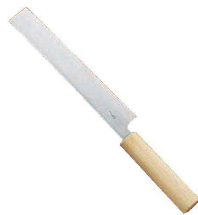
⑦ ❷雪藤 附庖丁 (AYK-31)

1-0536-0501 大 428×210×H69 ¥2,800 1-0536-0502 小 300×210×H69 ¥2,600