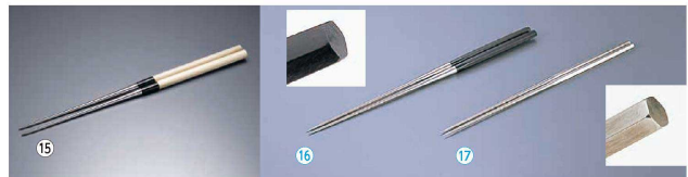
⑮ 本焼ステンレス朴柄盛箸 (BML-22)

mm 全長 g ¥ 1-0536-1501 120 260 49 ¥6,450 1-0536-1502 135 275 56 ¥6,550 1-0536-1503 150 290 59 ¥6,670 1-0536-1504 165 305 62 ¥6,850 1-0536-1505 180 320 65 ¥7,100 1-0536-1506 210 350 71 ¥7,600 1-0536-1507 240 380 83 ¥8,050 ●焼入れ、焼戻しを行っているので曲がりにくく強度にも優れています。 ※質量は1〜2g誤差があります。