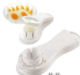
縦切りエッグカッター 洗 10 6分割(3本線) GM-1501 〈BET-21〉 1-0573-1001 ¥650