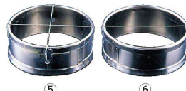
5 18-0 4つ切 玉子切器 〈BTM-16〉 1-0573-0501 ¥1,900 φ50×H20