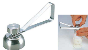
15 殻割り器 エッグハンマータッチ No.2275 〈BET-11〉 1-0573-1501 ¥1,000 φ34×全長100 材質:ステンレス ●殻の上部だけむくのはなかなか難しいものですが、これを使えば簡単に卵にかぶせ、バネをきかせてハンマーでたたくと、きれいな円形に割れ目が入り、殻をはずせます。