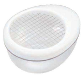
3 たまッシュ! CH-2102 〈BTM-49〉 1-0573-0301 ¥1,500 105×127×H65 材質:ワイヤープレート枠/ ABS樹脂(耐熱温度:80°C) 容器/AS樹脂(耐熱温度:90°C) ワイヤー/18-8ステンレス 容量:330ml