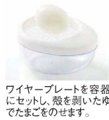
ワイヤープレートを容器にセットし、殻を剥いたゆでたまごをのせます。