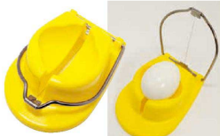
4 玉子半ぶんこ 〈BTM-43〉 1-0573-0401 ¥680 120×85 材質:本体/ポリプロピレン(耐熱120°C) 線材/ステンレス