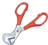
13 ウズラ カッター プッチー 〈BUZ-01〉 1-0573-1301 ¥1,400 全長:135(耐熱80°C)