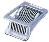
7 ウエストマーク エッグスライサー 1020 〈BUE-47〉 1-0573-0701 ¥4,960 127×82 材質:アルミダイカスト