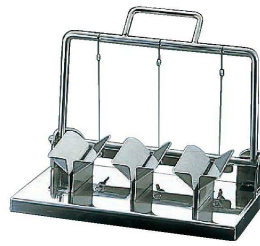
2 3連玉子カッター 縦割 〈BTM-22〉 1-0573-0201 ¥68,000 248×173×H67 質量:約1.25kg 材質:ステンレス ●替ワイヤー1セット付(3本)。