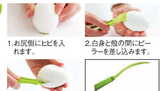
1.お尻側にヒビを入れます。 2.白身と殻の間にピーラーを差し込みます。 3.回しながら割り進めます。