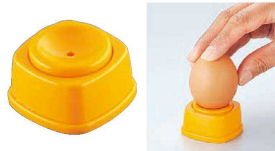
14 卵の穴あけ器 〈BTM-40〉 1-0573-1401 ¥180 50×50×H25 材質:本体/ABS樹脂 金属部/ステンレス ●ゆでる前に小さな穴をあけるだけで、卵の殻がきれいになります。