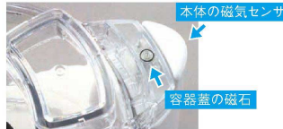
本体の磁気センサー

容器蓋の磁石を本体のマグネットセンサーが感知する構造になっており、正確にセットしないと主電源が入らない仕組みになっています。事故を未然に防ぐ安心設計です。