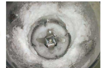
ロックアイス(調理後)