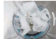
ロックアイス(調理前)

ロックアイスや冷凍フルーツなどある程度の固さ・大きさがある素材の粉砕が得意な刃。通常の攪拌は勿論、フローストドリンク・アイススムージー・ジェラートなどのメニューも調理可能です。