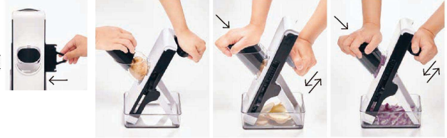
食材に合わせてスライスと千切りを簡単切り替え。