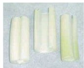
芯を抜いて切るタイプ (芯なしタイプ)