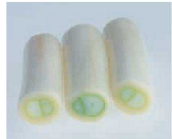
芯を抜かず切るタイプ (芯ありタイプ)