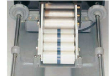
①投入口のウェートをもち上げる