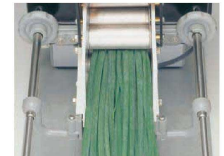
②ウェートとコンベアーの間にネギを差し込む(なるべく奥まで)