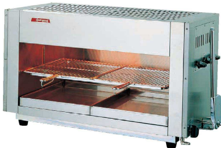
③ アサヒ上火式グリラー SG-900H(ハンドル式) (DGL-21) 価格 ¥244,000