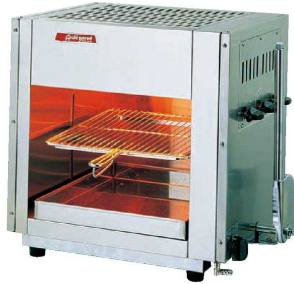
① アサヒ上火式グリラー SG-450H(ハンドル式) (DGL-19) 価格 ¥162,000