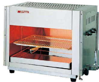
② アサヒ上火式グリラー SG-650H(ハンドル式) (DGL-20) 価格 ¥197,000