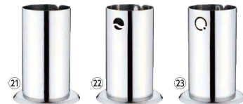
UK 18-8 串入れ ⑳ ラウンド (DKS-34) 1-0784-2101 ¥3,600 ㉑ サーフ (DKS-35) 1-0784-2201 ¥3,750 ㉒ ポップ (DKS-36) 1-0784-2301 ¥3,750 ㉑～㉒φ55×H105(ベースφ78)