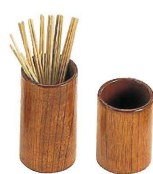
⑳ 木製 串立て (DKS-17) 目 1-0784-2001 大 SB-712 ¥2,700 φ60×H115 1-0784-2002 小 SB-713 ¥2,400 φ60×H85