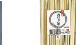
⑭ 竹製 十八番角おでん串 入数 (DOD-01)