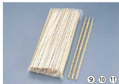
⑨ 竹製 角串ロング 300mm 2541(200本入) 入数