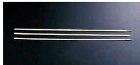
⑮ 竹製角串40cm(10本束) 入数 (DKS-30) 1-0784-1601 ¥240 約4mm角