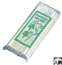
⑤ 竹製平串(100本入) 入数 (DKS-16)