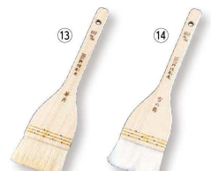
⑬ NEO料理刷毛 華月 (埋込式山羊毛) (BHK-78)