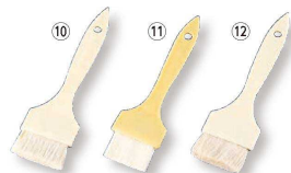
⑩ プラ柄 テリハケ(羊毛) (BHK-57)

●使いやすく手入れがしやすいナイロンの毛を使用しています。毛先があり、腰が強く粘度の強い食材を塗る時に最適です。 ●製菓、料理ハケとして万能にお使いいただけます。