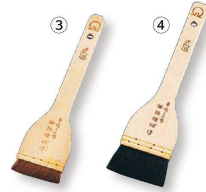
③ 馬毛 タレバケ (BHK-02)