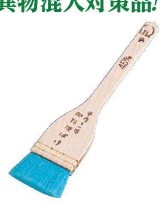
① 木柄 青ナイロン 折り曲げ刷毛 (BHK-D0)