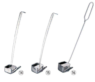
⑭ 18-8 新型うなぎタレカケ

(BHK-81) 1-0786-0901 ¥400 全長:153 毛の長さ:17 材質:毛/赤ナイロン ハンドル/竹柄