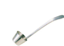
⑰ 18-8 ライラック ソース杓子 (PSC-36)

(BUN-03) 1-0786-1601 ¥1,660 全長:290 34c.c.