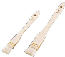
⑩ 木柄 三味糸綴じ 御料理刷毛 (山羊毛) (DHK-06)

全長:245 毛の長さ:40 ●使いやすいナイロンで作っており、毛が抜けにくく、お手入れが簡単です。