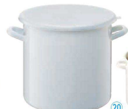
⑳ ホーローストックポット 丸型