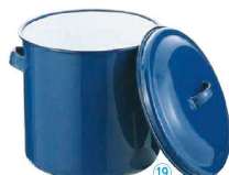
⑲ ホーロー キッチンポット (手付)