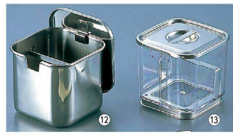
⑫ プレス 角タレ入 (モリブデン鋼)