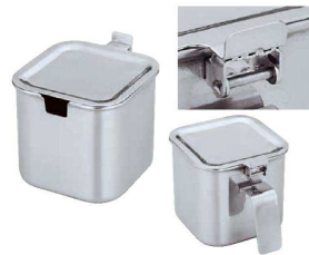
⑪ モリブデン角タレ入れ (丁番蓋付き)