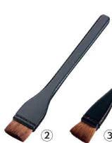
② 黒塗り柄刷毛 (馬鬃毛) 30mm

(BHK-C8) 1-0786-0201 ¥3,700 全長:213 毛の長さ:18 材質:ハンドル/木柄