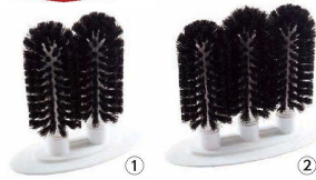
トラスト グラスウォッシャー

① ダブル 6728 (KTL-E4) 1-0792-0101 ¥6,900 200×90×H200