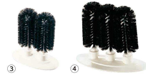
カーライルグラスウォッシャー

③ ツイン 40460 (JGL-17) 1-0792-0301 ¥9,400 185×100×H200