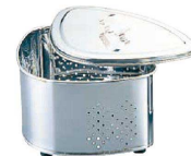
7 18-0 抗菌ステンレス 蓋付三角コーナー CK-114 (JSV-33) 1-0796-0701 ¥2,040 A200×B160×C114 ●汚れにくく、清潔で丈夫。洗っても簡単なステンレスに抗菌力をプラス。 ●蓋付ですので使用後は中のゴミが見えず、使用中は蓋にフックがついており本体に掛けられます。