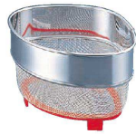
2 ステン エイブル 三角コーナー L-122 ミニ (JSV-98) 1-0796-0201 ¥1,200 180×130×100