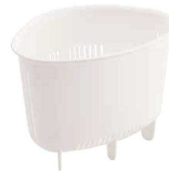
13 ホーム&ホーム コーナーポケット (ポリプロピレン) (DKC-06) 1-0796-1301 ¥640 A200×B150×C147