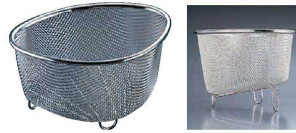
3 18-8 三角コーナー 水きれーる (JSV-29) 1-0796-0301 ¥2,050 220×165×H120 ●斜めの底で素早く水切れできます。 ●シンクに水で中身が濡れにくい定高タイプ。