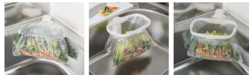
15 三角コーナーいらす BP 本体 (DSV-83) 1-0796-1501 ¥330 リング寸法:161×147 材質:リング/ポリプロピレン 吸着盤/塩化ビニール ●シンクに合わせて水平または垂直に設置できます。 ●専用袋5枚付。 ※吸着盤が着きにくい場合は、付属の補助板をご使用ください。