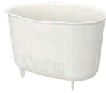
12 クッキングパル 三角コーナー K-1344WH L (DSV-85) 1-0796-1201 ¥4,430 A220×B173×C148 材質:ポリプロピレン