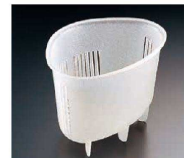
14 ミューファン 流しコーナー L (DMY-02) 1-0796-1401 ¥640 A200×B150×C147 材質:ポリプロピレン (耐熱100℃) ●抗菌性の高い μ-func.ミューファン®製