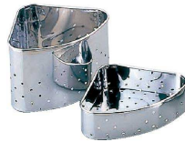
9 18-0 三角コーナー (JSV-05) A B C 1-0796-0901 特大 200×165×130 ¥1,120 1-0796-0902 大 200×160×70 ¥900 1-0796-0903 小 200×160×50 ¥780