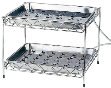
1 18-8 2段式 ウォーターコランダー (EKL-01) 1-0799-0101 大 360×470×H340 ¥27,600 1-0799-0102 小 285×430×H320 ¥24,700