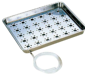
2 18-8 ウォーターコランダー (大) (EKL-02) 1-0799-0201 ¥9,000 350×440×H50