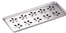
4 18-8 ミニ ウォーターコランダー (EKL-04) 1-0799-0401 ¥4,200 178×408×H20