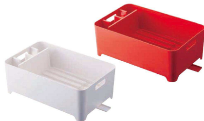
7 水切りバスケット (EMZ-17) 目 ¥2,700

1-0799-0701 02630 ホワイト 1-0799-0702 02632 レッド 380×240×H130 材質: 本体、水はけ/ABS樹脂 止水栓/シリコン樹脂