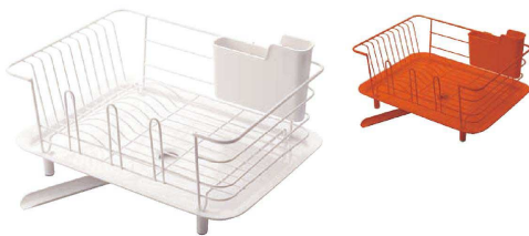
6 ディッシュドレイナー (EDI-15) 目 ¥4,030

1-0799-0601 ホワイト 1-0799-0602 レッド 395×300×H207 材質: ラック本体/スチール トレー・種・ポケット/PP 滑り止め/エラストマー