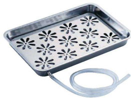
3 18-8 ウォーターコランダー (小) (EKL-03) 1-0799-0301 ¥7,400 275×400×H40