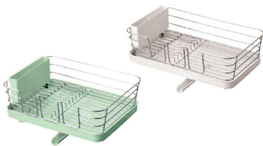
5 Nボゼ縦横兼用クリアコート水切り (EKL-10) 目