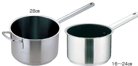
① Murano(ムラノ) インダクションテフロンセレクト18-8 片手深型鍋 (蓋無) (AKT-D2)