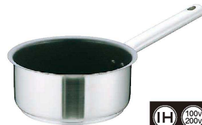
② Murano(ムラノ) インダクションテフロンセレクト18-8 片手浅型鍋 (蓋無) (AKT-D4)