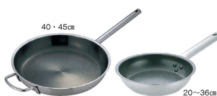
⑤ Murano(ムラノ) インダクションテフロンセレクト18-8 フライパン (AHL-V7)