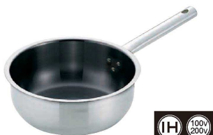
④ Murano(ムラノ) インダクションテフロンセレクト18-8 ソテーパン (AST-I2)