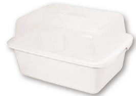
② クッキングパル 水切りセット フード付きM型 K-1658FWH

(EMZ-97) 1-0800-0201 ¥3,120 405×295×H230 材質:本体・フタ/ポリプロピレン