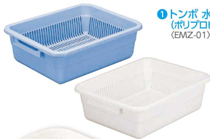
① トンボ 水切籠セット (ポリプロピレン・抗菌防カビ加工) (EMZ-01)