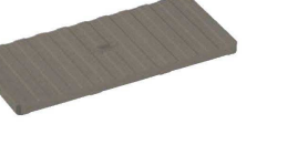
⑪ ティッシュケース ホワイト 53676 (JOE-27) 1-0800-1101 ¥1,200 245×130×H70 材質:ABS樹脂 ●フタが下がっていく造りなので最後まで取り出しやすいです。 ●マグネット付。

1-0800-1001 ¥800 135×160×H122 材質:ポリプロピレン