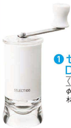
1 セレクト100GL お茶ミル DH-3136 〈EOT-03〉 1-0875-0101 ¥3,300

φ63×H140 材質:本体/ポリプロピレン、ポリアセタール、ステンレススチール、メタクリルスチレン ハンドル/18-8ステンレス、ポリプロピレン白/セラミック磁器 ●お好みの粗さに調整できる「粗さ調整機能」付き。 ●収納時はハンドルを本体にセットできるコンパクト設計です。