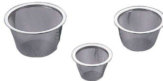
5 18-8 急須用 茶こしアミ (40メッシュ) (BTY-30)

115×98×H155 電源:単相100V 50/60 Hz 消費電力:55W 定格時間:90秒 回転数:約28,000rpm(無負荷時) 最大調理量:10g(緑茶) 電源コード長:約1.4m 付属品:レンヒピック、粉末緑茶保存缶、ブラシ、スプーン ●使い方に合わせた、ひきかた調整機能付き