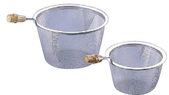
6 18-8 竹柄付 急須用 茶こしアミ (40メッシュ) (BTY-75)