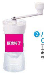
2 ハリオ お茶ミル・チャコ OMC-1-SG 〈EOT-02〉 1-0875-0301 ¥3,500

φ63×H140 材質:本体/ポリプロピレン、ポリアセタール、ステンレススチール、メタクリルスチレン ハンドル/18-8ステンレス、ポリプロピレン白/セラミック磁器 ●お好みの粗さに調整できる「粗さ調整機能」付き。 ●収納時はハンドルを本体にセットできるコンパクト設計です。