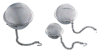
8 18-8 ボール茶こし (40メッシュ) (BTY-43)