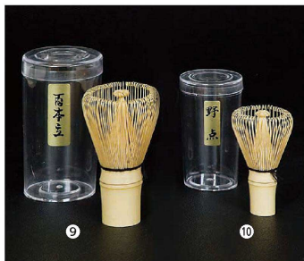
9 茶せん(100本立) 並 39-609B 〈BTY-76〉 1-0875-0901 ¥3,500 φ60×H105