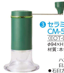
3 セラミックお茶ミル CM-50GT 〈EOT-01〉 1-0875-0301 ¥5,500

φ94×H172 材質:本体/ポリプロピレン、ポリアセタール、鉄、AS樹脂 ハンドル/鉄、ポリプロピレン白/セラミック磁器 ●石臼方式を採用する事できめ細やかな粉末茶を簡単に作る事ができます。 ●お料理に合わせて粗さ調節できる「粗さ調節機能」付です。