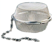
7 18-8 平型ボール茶こし (BTY-84)