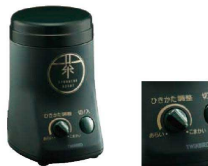
4 お茶ひき器 緑茶美採 GS-4671 〈ETY-10〉 1-0875-0401 ¥15,000

115×98×H155 電源:単相100V 50/60 Hz 消費電力:55W 定格時間:90秒 回転数:約28,000rpm(無負荷時) 最大調理量:10g(緑茶) 電源コード長:約1.4m 付属品:レンヒピック、粉末緑茶保存缶、ブラシ、スプーン ●使い方に合わせた、ひきかた調整機能付き