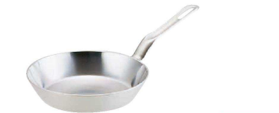
1 Ωスーパーデンジ フライパン (共柄) (AHL-D6)