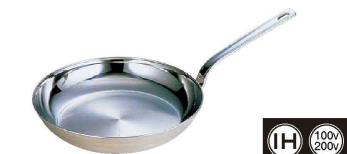
6 18-10ロイヤル フライパン XFD (AHL-03)