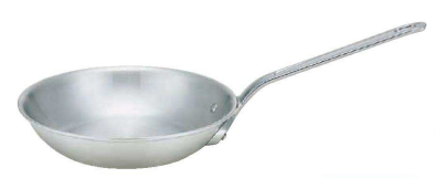
3 アルミ プロマイスター IH BCフライパン (AHL-S2)