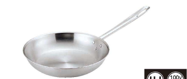
2 トリノ フライパン (AHL-T9)