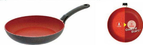
全体の色が変わるから誰でもわかる!