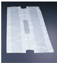
⑨ 無地バンバン (100枚入) (XMZ-04) 入数 巾 長さ 折込 厚さ 価格 No.3 181767 350×450×40 0.025 ¥3,600 No.5 181768 350×530×40 0.03 ¥4,600 材質:HDPE ●ピザボックスや寿司桶の持ち帰りに最適です。