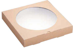
① クラフトピザBOX窓付き 正角 (25枚入) 入数 (XPZ-36) 1-0967-0101 ¥7,000 280×278×H47