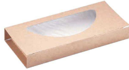
② クラフトピザBOX窓付き ハーフ (25枚入) 入数 (XPZ-37) 1-0967-0201 ¥7,000 303×135×H42