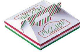
③ ピザ箱 (50枚入) (XHK-03) ¥12,200 入数 1-0967-0301 No.12-14B 中 8インチ 205×205×H30 (組立前560×370) 1-0967-0302 No.12-15 大 9インチ 230×230×H30 (組立前630×430) ※御注文の際は、入数単位でお願いします。