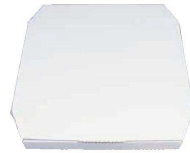
⑤ ピザボックス 白 (200枚入) 187648 8インチ 入数 (XPZ-38) 1-0967-0501 ¥21,000 210×210×H40