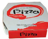
⑧ ピザキャリーボックス 赤 (50枚入) (XPZ-39) 入数 インチ用 1-0967-0801 8 15472 215×215×H45 ¥7,200 1-0967-0802 10 15473 270×270×H45 ¥8,000 1-0967-0803 12 15474 310×310×H45 ¥10,000 1-0967-0804 14 15475 365×365×H45 ¥11,600