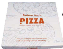
⑦ ピザカートン (50枚入) (XPZ-02) 入数 インチ用 1-0967-0701 10 72055 254×254×H38 ¥15,200 1-0967-0702 12 72056 305×305×H38 ¥16,800 1-0967-0703 14 72057 358×358×H44 ¥22,300