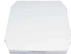
⑥ ピザボックス 白 (100枚入) (XPZ-01) 入数 インチ用 1-0967-0601 10 196886 275×275×H45 ¥16,000 1-0967-0602 12 196887 325×325×H45 ¥20,000 1-0967-0603 14 196888 362×362×H38 ¥21,000