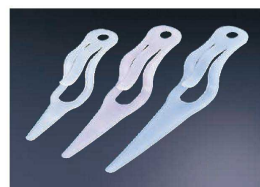
⑩ P.P. ピザハンド (GPZ-08) 抗菌 1-0967-1001 大 約35cm用 全長:220 ¥140 1-0967-1002 中 約25cm用 全長:190 ¥130 1-0967-1003 小 約20cm用 全長:155 ¥120 材質:ポリプロピレン 耐熱温度:120℃ ●ピザをつかんでそのまま手を汚さずに食べられます。 ●裏面にはピザが落ちないようにすべり止め加工が施してあります。