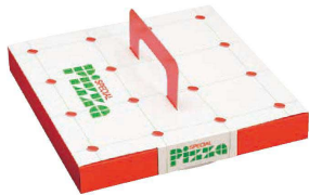
④ ピザパイスペシャル (50枚入) (WPZ-66) 入数 インチ用 1-0967-0401 7 02108 215×215×H30 ¥8,700 1-0967-0402 9 02109 233×233×H30 ¥9,300