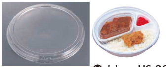
11 カレー HS-323 (50入)

(GKL-35) 1-0991-1001 本体 70934 232×232×H50 ¥6,500 1-0991-1002 フタ 70936 232×232×H16 ¥5,160 材質:本体/低発泡ポリスチレン フタ/二軸延伸ポリスチレン 容量:ごはん/約440g ルー/約380cc ●ルーとご飯をわけて盛り付け可能なカレー容器です。 ●本体のみレンジ対応です。