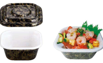
6 どん重 まきめりセット

1-0991-0401 本体 RRAI650 230×185×H43 ¥2,600 1-0991-0402 フタ穴付 RRAI651 230×185×H23 ¥2,100