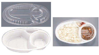
8 カレー容器 VK-51 白(50入)

④⑤ 材質:本体・中カップ/ポリプロピレン+無機物 フタ/二軸延伸ポリスチレン 耐熱温度:本体・中カップ/130℃ フタ/80℃ ●⑤中カップと本体で別々にレンジが可能。 ※フタはレンジ非対応です。