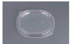
3 グルメ丼20 蓋K

(GGL-74) 1-0991-0201 本体K 180230 160×160×H62 ¥3,550 1-0991-0202 中皿1K 180231 166×166×H28 ¥2,580 ●本体にしっかりと、パチッとほまる中皿です。 ●本体は耐熱発泡素材を使用してる為、レンジ後も安心して持てます。