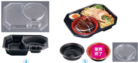
4 つけ麺 黒(50入) (GTK-86)

180229 (50入) (GGL-75) 1-0991-0301 ¥1,480 149×149×H13 材質:ユーガード ●天面を広く設け、中身がよく見えます。 ●嵌合蓋でタレ物も安心です。 ※蓋は中皿とセットでご使用ください。