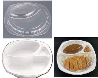
10 BFカレー 内11 白(50入)

(GKL-34) 1-0991-0901 本体 242×155×H45 ¥4,880 1-0991-0902 フタ 243×156×H24 ¥2,640 材質:本体/エクスター(耐熱・耐油ポリスチレン) フタ/二軸延伸ポリスチレン 容量:ごはん/約280g ルー/約240cc ●本体のみレンジ対応です。