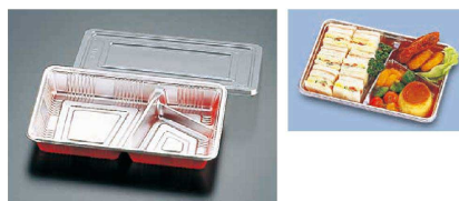
⑩ 仕切付弁当容器 透明蓋付 入販 (100セット入) (GBV-19)