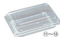
⑪ カチットパック SHL-2-A 入販 (50パック入)