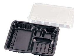
③ FM弁当容器 透明蓋付 (20セット入) 入販 (XBV-05)