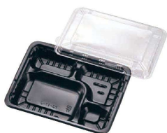
① FM弁当容器 透明蓋付 (20セット入) 入販 (XBV-07)