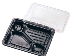
② FM弁当容器 透明蓋付 (20セット入) 入販 (XBV-08)

①~④ 材質:本体/ポリプロピレン 蓋/ポリスチレン 耐熱温度:本体110℃/蓋80℃ ●内かんごう蓋タイプでテープ止めが不要。 ●本体のみレンジ対応です。