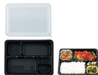
⑥ ワンウェイ 耐熱お弁当容器 入販 EW-500 (蓋付・50セット入)

(XAZ-58) 目 1-0992-0501 ¥2,200 238×201×H32 4仕切 [8] ⑤⑥材質:本体/リサイクルポリスチレン(耐熱140℃) 蓋/ポリスチレン ●本体のみレンジ対応です。