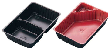
⑧ アジロ弁当 中仕切 入販 (50入) (XAZ-51) 目

材質:本体/PPF 蓋/ポリスチレン ●竹かご風の使い捨て弁当箱で、生の竹よりもカビや虫に強く保管が簡単です。