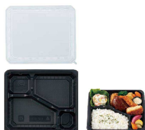
⑤ ワンウェイ 耐熱お弁当容器 入販 EW-400 (蓋付・50セット入)

(XBV-06) 1-0992-0401 ¥1,600 外寸:229×169×H34 ごはん容量目安:約200g