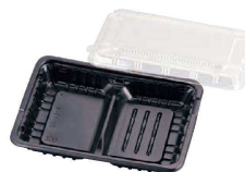
④ FM弁当容器 透明蓋付 入販 中D (20セット入)

(XBV-06) 1-0992-0401 ¥1,600 外寸:229×169×H34 ごはん容量目安:約200g