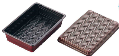
⑦ アジロ弁当 蓋付き 入販 (50セット入) (XAZ-50) 目

(XAZ-59) 目 1-0992-0601 ¥2,300 264×196×H32 5仕切 [8]