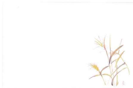
6 M30-214 すずき(9月~11月)