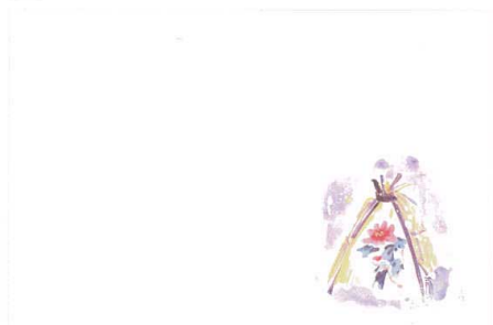
8 M30-255 寒牡丹(10月~12月)