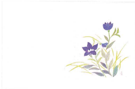
3 M30-252 ききょう(8月~9月)