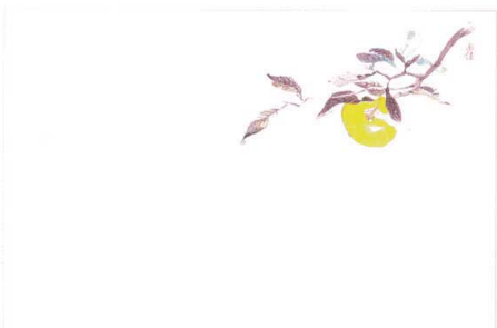
9 M30-215 ゆず(10月~12月)