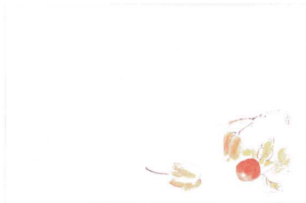
1 M30-210 ほおずき(7月~8月)