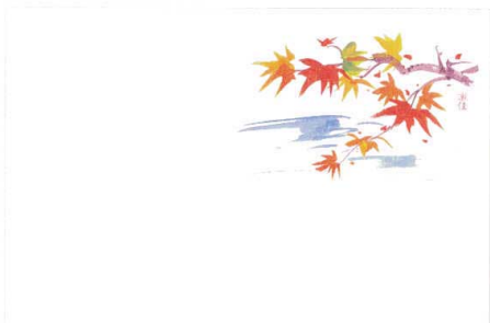
7 M30-213 もみじ(9月~11月)