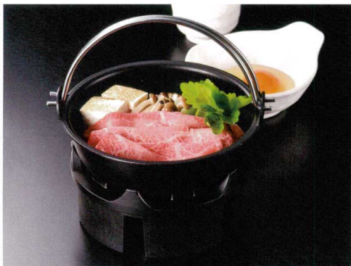
使用商品/黒鍋 φ17 ツル付(M11-092)・グリルこんろ(M11-721)・火入れ(別)プレス(M10-913) ※こんろに仕様変更がございます。