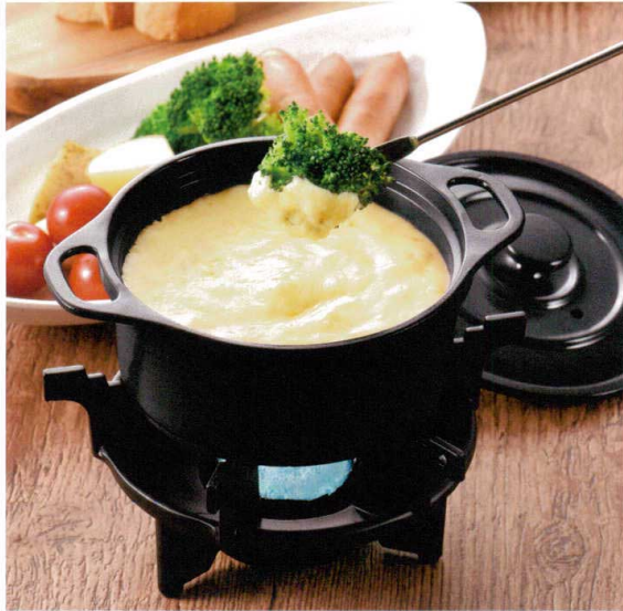
使用商品/ミニココ φ12 黒(アルミ) (M11-078)・花梨こんろ 6本ツメ五徳 (M11-317)