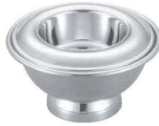
②UK 18-8 台付 スプリームサーバー