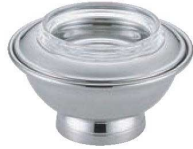
①UK 18-8 スプリームサーバー (ガラス付)