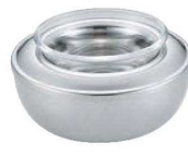
③UK 18-8 ロイヤル 台無 スプリームサーバー (ガラス付)