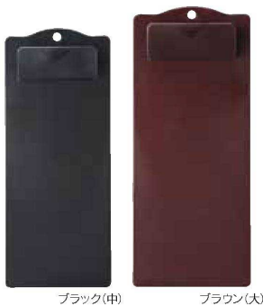
成型バインダー 小 ABS <CN> QW-2866 ブラック ¥340 90×165 (50) QW-2868 ブラウン ¥340 90×165 (50) 成型バインダー 中 ABS <CN> QW-2870 ブラック ¥370 90×220 (50) QW-2871 ブラウン ¥370 90×220 (50) 成型バインダー 大 ABS <CN> QW-2873 ブラック ¥400 100×238 (50) QW-2874 ブラウン ¥400 100×238 (50)