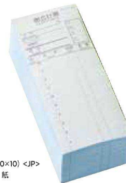
QW-4162 会計伝票 複写切り取り式 ¥4,200/10冊 (10×10) <JP> 85×200 1冊2枚複写50組 紙