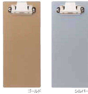
プラストロングバインダー <JP> QW-8287 ゴールド ¥670 90×205 QW-8288 シルバー ¥670 90×205