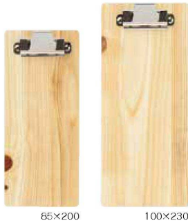
ブラ両面白木タイプバインダー <JP> QW-8290 85×200mm ¥750 85×200 QW-8289 100×230mm ¥870 100×230