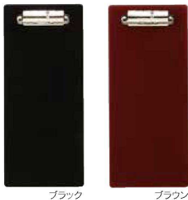
伝票クリップ S PVC<JP> QW-3177 ブラック ¥460 90×210 (1×50) QW-3185 ブラウン ¥460 90×210 (1×50)