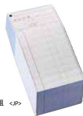
QX-4404 会計伝票 横のり日本語 ¥4,100/500組 <JP> 80×175 2枚複写