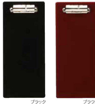
伝票クリップ M PVC<JP> QW-3173 ブラック ¥480 100×235 (1×50) QW-3175 ブラウン ¥480 100×235 (1×50)